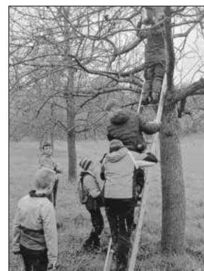
Mitglieder der Jugendgruppe beim Säubern der Nistkästen