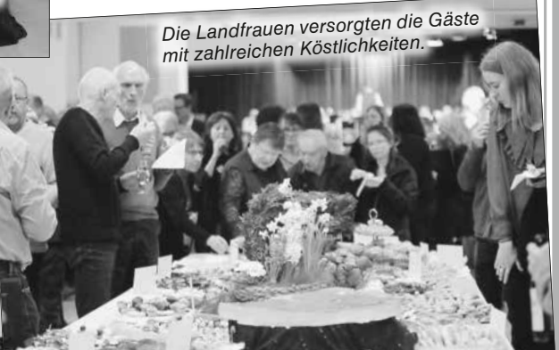
Die Landfrauen versorgten die Gäste mit zahlreichen Köstlichkeiten.