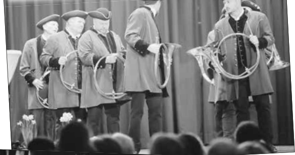
Jagdhornbläser Mittelmühle e. V. – Tradition und Musik vereinen sich.