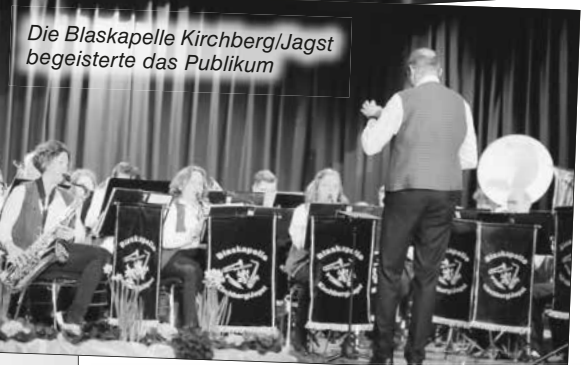
Die Blaskapelle Kirchberg/Jagst begeisterte das Publikum