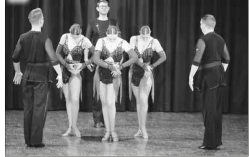
Die Tanzsportabteilung der TSG Kirchberg 1861 e. V. brachte Eleganz und Rhythmus auf die Büh- ne.