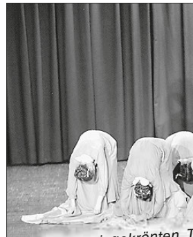
Die preisgekrönten T Kirchberg/Jagst bege ihren ausgefallenen C