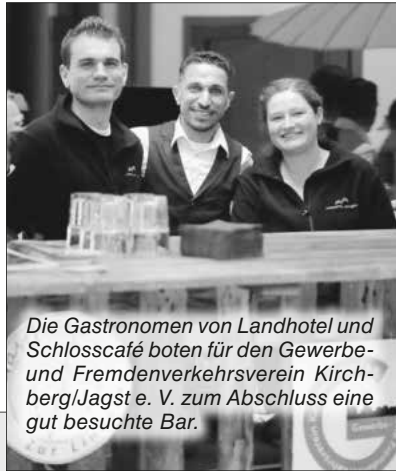
Die Gastronomen von Landhotel und Schlosscafé boten für den Gewerbe- und Fremdenverkehrsverein Kirch- berg/Jagst e. V. zum Abschluss eine gut besuchte Bar.