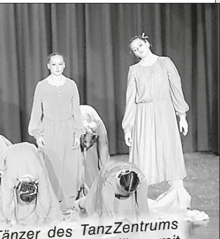
änzner des TanzZentrums existierten das Publikum mit choreografien.