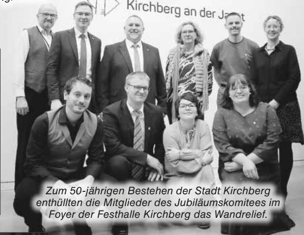
Zum 50-jährigen Bestehen der Stadt Kirchberg enthüllten die Mitglieder des Jubiläumskomitees im Foyer der Festhalle Kirchberg das Wandrelief.